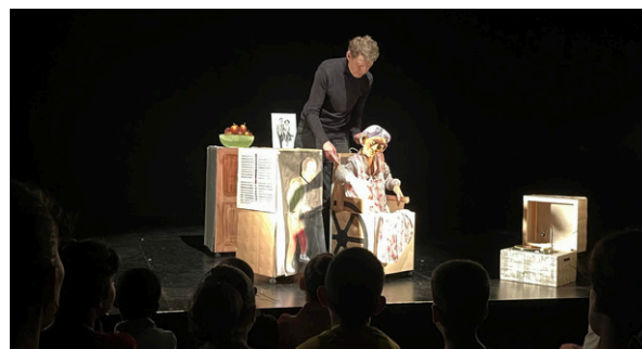
Compagnie Bldul'théâtre, 2024